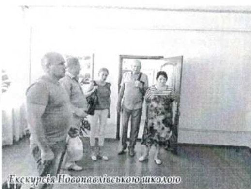
Екскурсія Новопапалівською школою

села. У ході зустрічі присутні обговорили проблемні питання розвитку територіального округу.