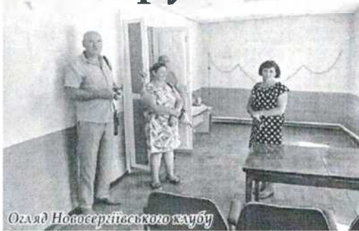
Огляд Новосергіївського клубу

У Новоіванівській школі на керівників міської ради чекав актив